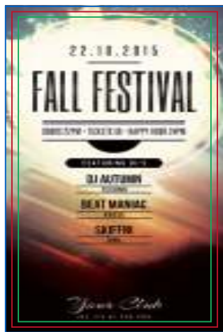
Página 01 Impressão